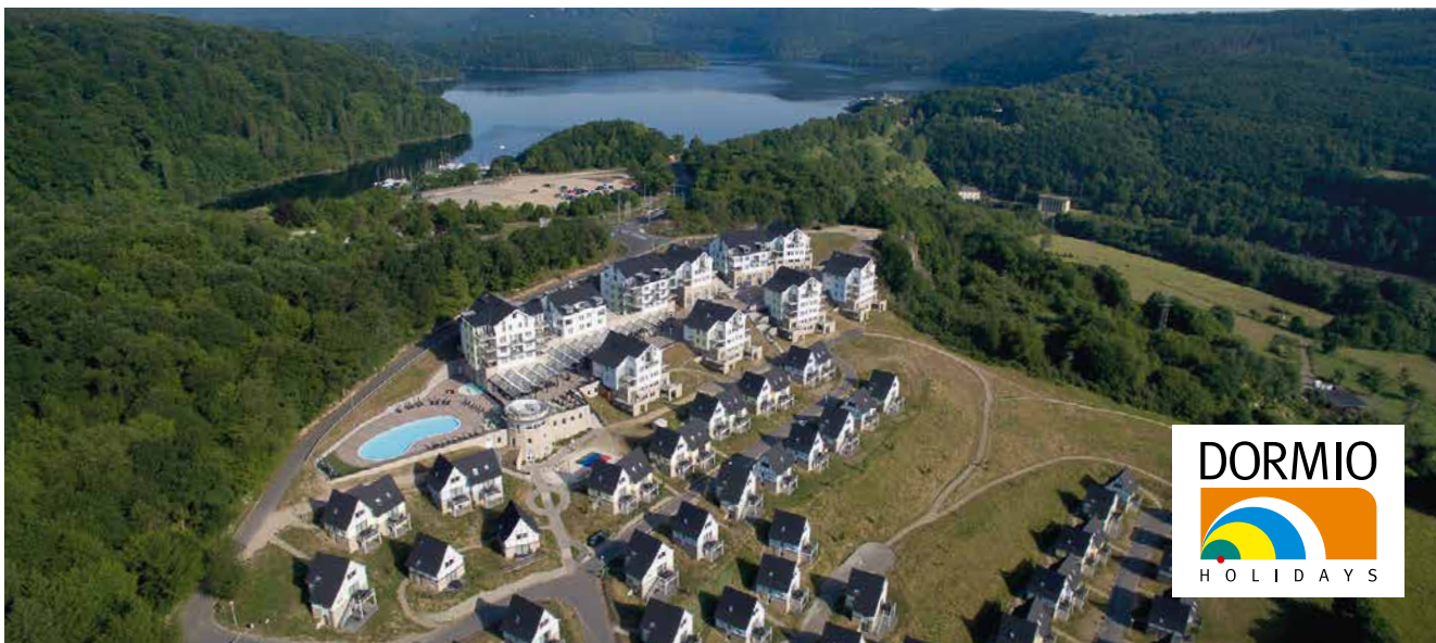
Dormio Holidays sorgt schon bald für die Vermietung im Resort Eifeler Tor!

Nach 10-jähriger Zusammenarbeit haben sich die Eigentümer unserer Unterkünfte dazu ausgesprochen, die Vermietung an Dormio Holiday's abzugeben. Dormio ist der Gründer des Resort Eifeler Tor. In 2012 hat Dormio Investments mit dem Bau des Resorts angefangen und Landal war seit Eröffnung der Vermarktungs- und Vermietungspartner. Ab dem 01.01.2021 wird nun die gesamte Leitung in den Händen von Dormio liegen. Damit wird „alles unter einem Dach“ gemanagt!