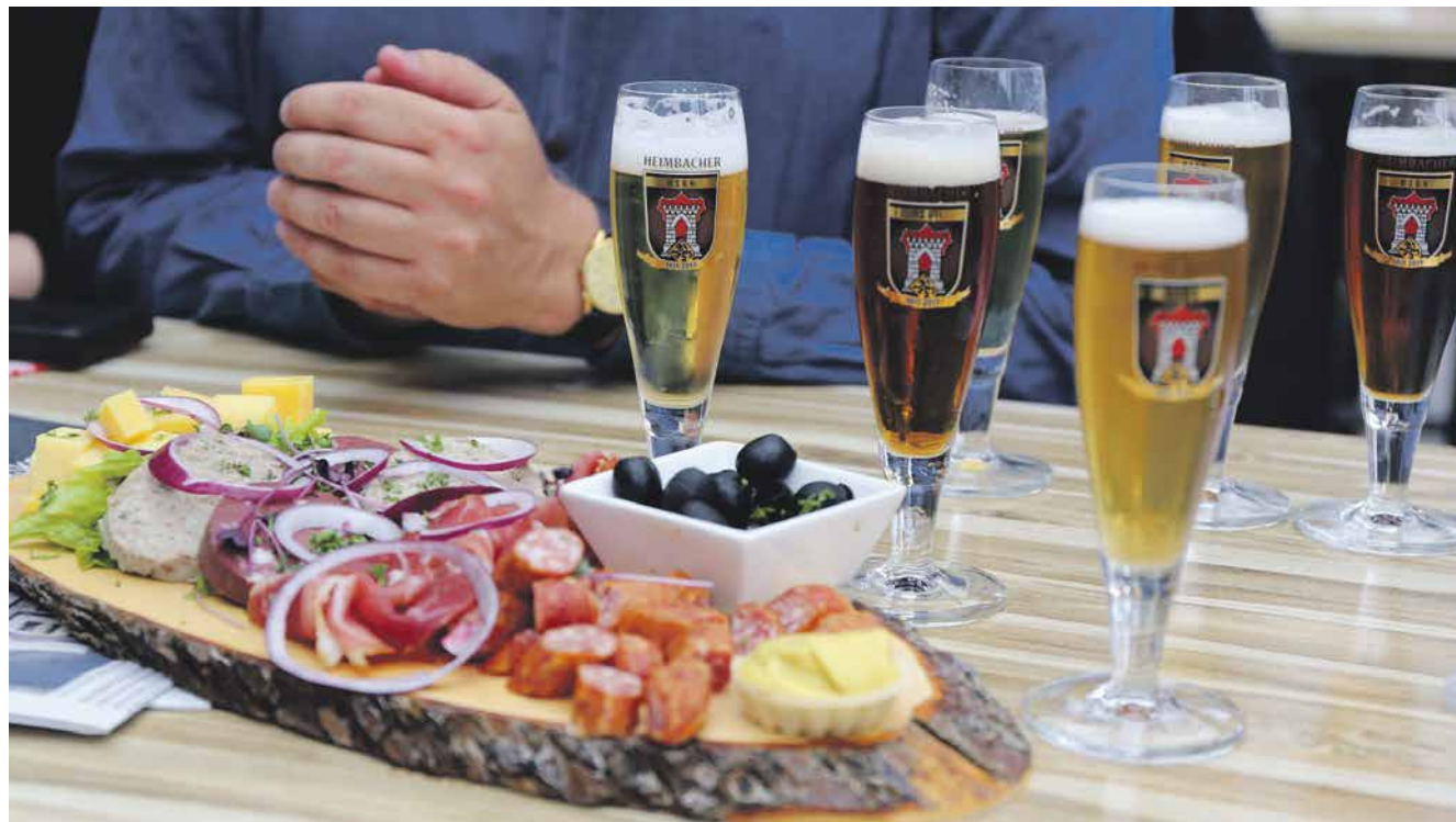
Ein erfrischendes Heimbacher Bier und deftige Speisen im Brauhaus

Bestellen Sie doch mal unser Heimbacher Bier, das man nur im Resort Eifeler Tor und im Heimbacher Edeka kaufen kann.