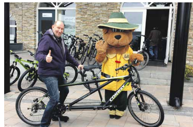
Bollo und Doc.Fahrrad

Fahrradfahren ist so schön! Wären da nicht die vielen Berge und steilen Anstiege in der Eifel. Auch um den Rursee ist es nicht flach. Aber keine Sorge, im Fahrrad-Shop eifelRAD wird Ihnen weitergeholfen. Hier können Sie fast alles ausleihen oder kaufen. Vom gemütlichen Elektro-Fahrrad bis hin zum sportlichen E-Mountainbike. Mit Kinderanhänger, Helmen, Körben: alles was das Herz begehrt. Wer sich selbst etwas quälen möchte, kann auch ein normales Mountainbike bekommen. U-Velo oder Doc.Fahrrad, so wird der Fahrrad-Vermieter im Landal Park auch oft genannt, lässt Sie aber nicht so einfach losfahren, sondern gibt Ihnen, wenn gewünscht, wertvolle Tipps, Touren- und Einkehrvorschläge. So erleben Sie einen königlichen Tag auf dem E-Rad von eifelRAD. www.eifelrad.de