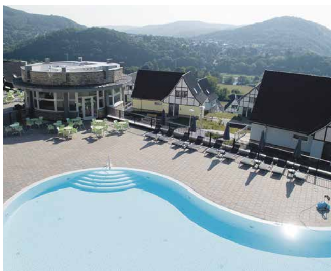
Erleben Sie den Sommer bei uns in der Eifel!

Im Resort ist was los! Wir haben für unsere Gäste eine kleine Übersicht zusammengestellt, wo Ausflüge, Veranstaltungstipps und besondere Events aufgelistet sind. Aufgrund der aktuellen Situation können Abweichungen und Änderungen im Veranstaltungskalender entstehen. Für weitere Informationen melden Sie sich einfach an der Rezeption oder bei der Rureifel-Tourismus im Park.